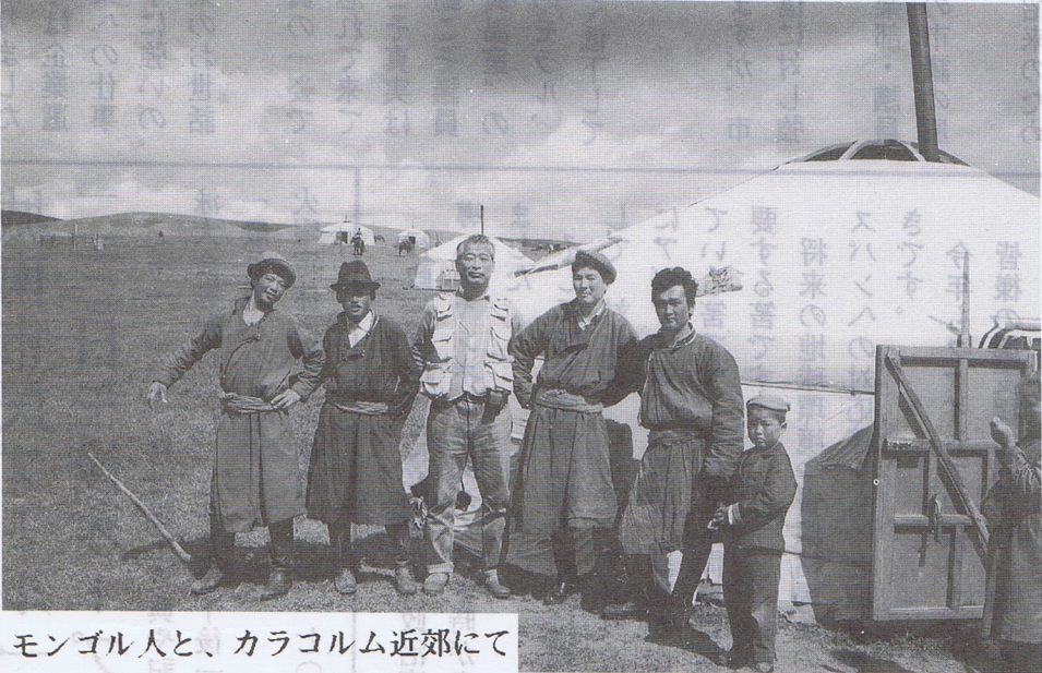
モンゴル人と、カラコルム近郊にて